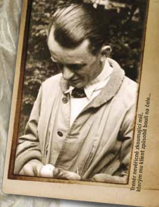
Trenér nevěřičně zkoumající míč, kterým mu klient způsobil bolus na čele...