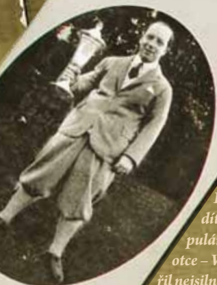
Mistr roku 1930 s Masarykovým pohárem