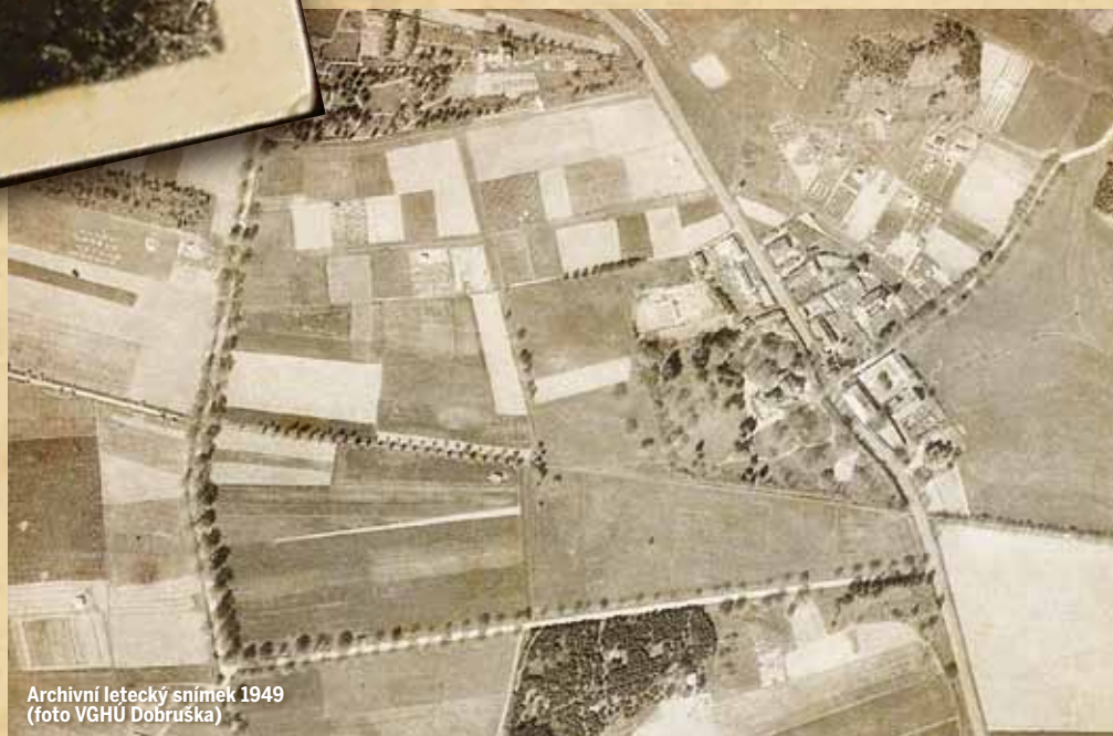
Archivní letecký snímek 1949

Abychom si vůbec dokázali udělat představu o hřišti, použili jsme svoji obvyklou pracovní metodu: průzkum v archivu VGHÚ Dobruška. Nalezená letecká fotografie pochází z prvního vojenského snímkování dané lokality v r. 1949. Na obrázku bohužel nejsou patrné – tou dobou již několik let zarostlé – dráhy. Nejdále přežívajícími markanty jsou i zde písčité bunkery. Hřiště mělo zprvu jen tři jamky, posléze pět, než bylo koncem 20. let rozšířeno na devět reverzních drah,