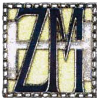
Monogram z dopisních papírů (30. léta)