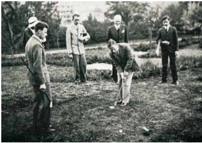
Dobové fotografie z Tennis-Golf revue – ke zprávě o zahájení v r. 1930

D ejvický zámek Hadovka připomíná šlechtické sídlo z viktoriánské Anglie. Tato neobyčejná patrová stavba podkovovitého půdorysu, která jako by do Čech ani nepatřila, upoutává pozornost zejména svou nezaměnitelnou, bohatě členěnou fasádou se stupňovitými štíty, krytými sedlovými stříškami a bohatě rámovanými okny a portály s rezným ostěním. Někdejší usedlost, později přestavěná v romantickém stylu, se