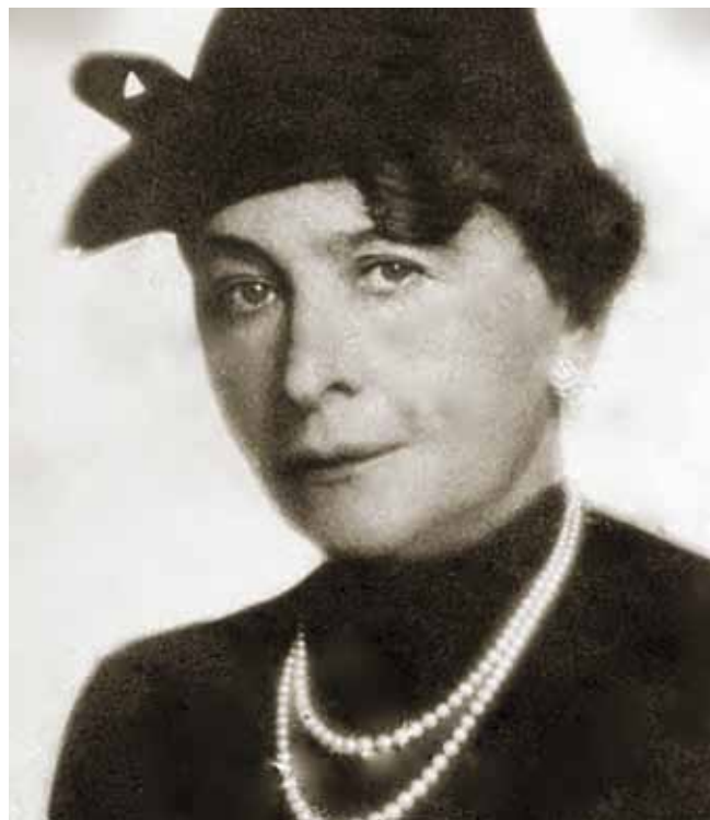
Portrétní foto z období před r. 1950 (ve věku 70 let)