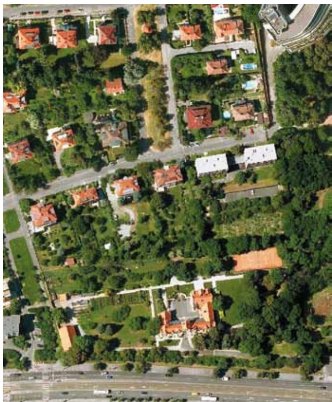
Na ortofotomapě ze současnosti