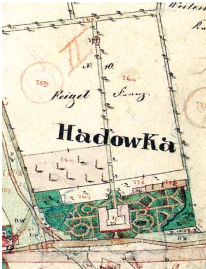
Hadovka na mapě Stabliního katastru, 1840–1842