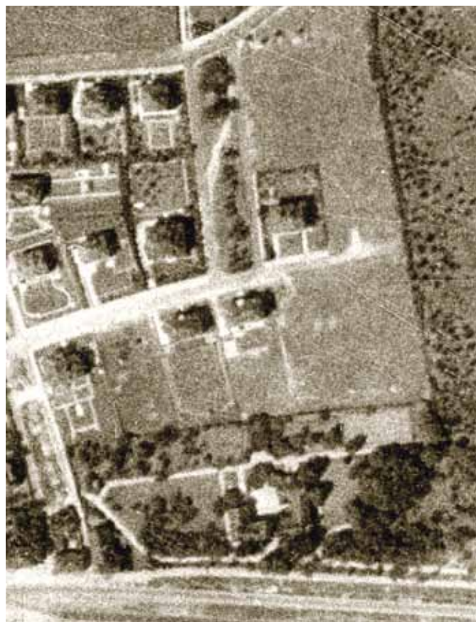
Na leteckém snímku, 1938