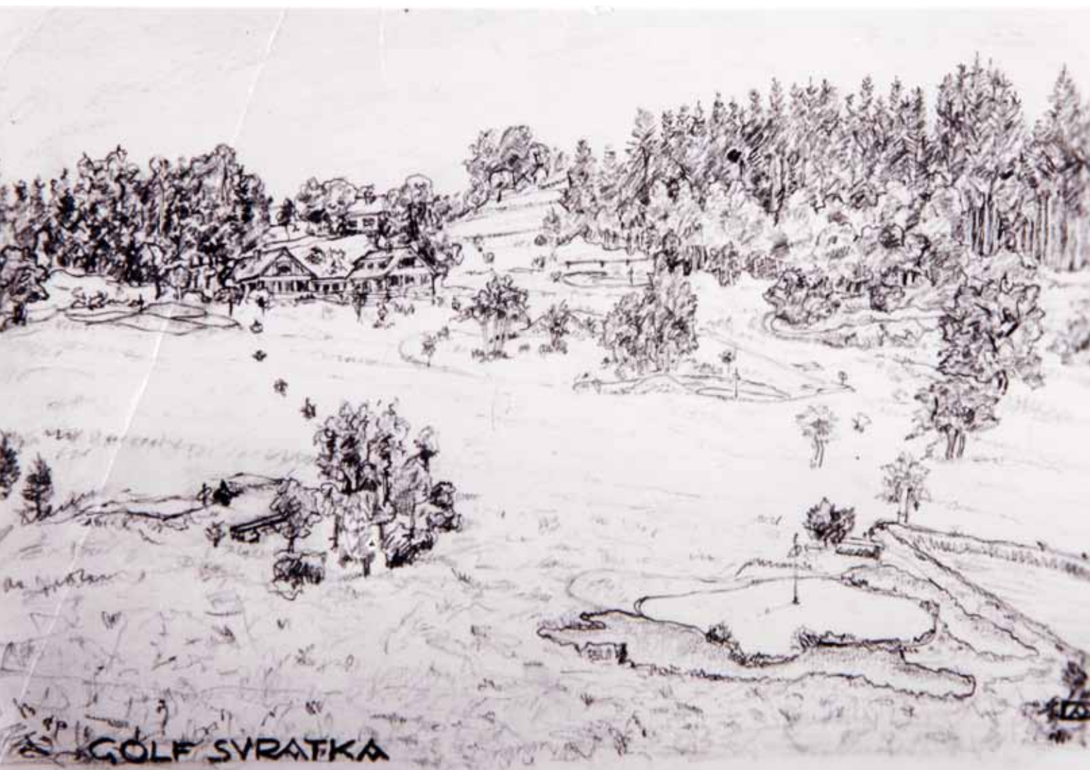
Grünerův statek pod Karlštejnem – dobová fotografie a kresba z přibližně stejného místa (40.léta)

počátku zde byly uplatněny jisté kompoziční prvky, které se zachovaly až do dnešní doby – zdvojené greeny či naopak společná odpaliště určitých jamek, dlouhé herní osy apod.