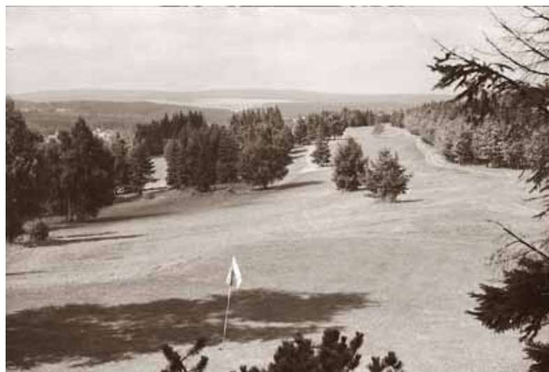
Záběr ze hřiště v r.1975 – zeleň v poločase vzrůstu oproti současnosti