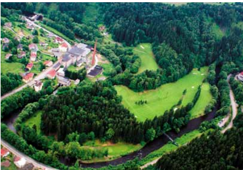
Obdobný záběr ze současnosti (třetí most vpravo dole)