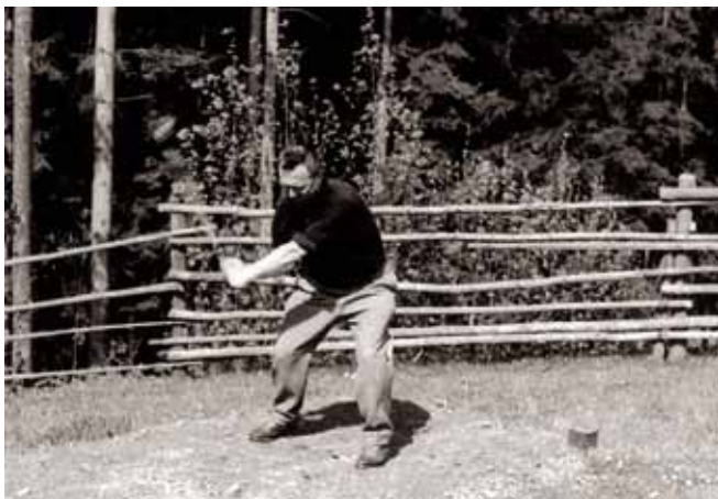
Odpal na družstevní pastvě

a dnes bezpečně uložené v městském archivu). Kromě směrů hry a terénní konfigurace je z nich patrná poloha jamkovišť, budovných těžkou zemědělskou technikou a osévaných „vděčnými paci-