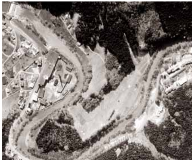
Meандр Jizery v r. 1976 (druhý most vpravo nahoře)