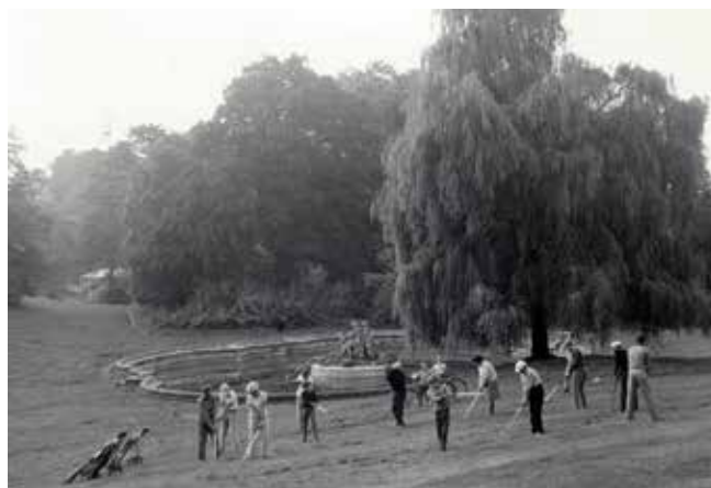
Neptunova kašna na dráze č. 1 – místo prvních tréninků (i konfliktů s koupajícími se rekreaty)

Špatné svědomí politiků nemělo být vykoupeno žádným strukturálním strategickým obratem, nýbrž sérií dílčích náprav, spočívajících v rozvolněnějších urbanistických koncepcích (pro regionální sídelní útvary měly platit příznivější než celostátně závazné územní plánovací regulativy), vytvoření masivního rehabilitačního a sportovně-rekreačního zázemí v širokém oblouku, sahajícím od Jeseníků přes střední Moravu až na severozápadní Slovensko. Pomineme-li některé z investic JZD Slušovice, ve své době