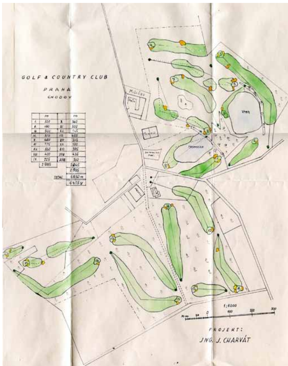
Nerealizovaný projekt z r.1934