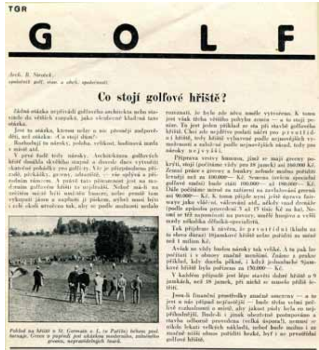
Stať arch.B.Sirotky, publikovaná v TGR r.1932

organizovaných zahraničním odborným tiskem, později i uznání z úst předsedy nově založené Evropské golfové asociace (EGA). Pro inženýrskou komoru sestavil Ceník projektových prací pro