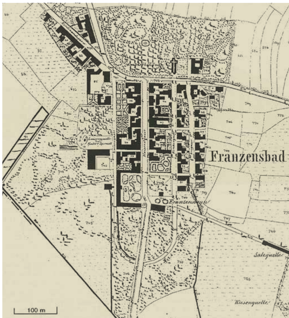
Plán města FL na mapě Stabliního katastru (1841)

byla nedaleko od sebe vybudována najednou tři hřiště. O tom karlovarském v tehdejší Kaiserparku a hřišti v Mariánských Lázních existuje alespoň několik zpráv, které dokládají založení klubu, výstavbu areálu, jména klubových členů, jejich hlavních představitelů atd. Informace o starém golfovém hřišti ve Františkových Lázních jsou však jen velmi kusé. Pocházejí především z dobového tisku a z částečně dochované korespondence mezi městem, lázeňskou komisí a tenisovým klubem.