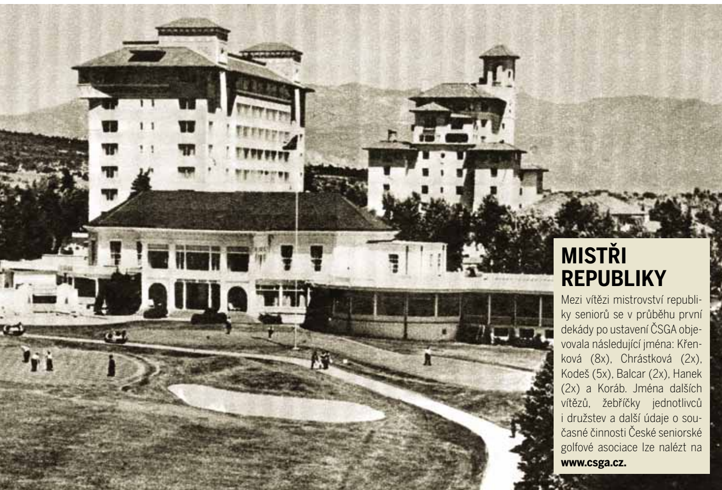
Klubovna u hotelu Broadmoore v Colorado Springs, v popředí green č. 15