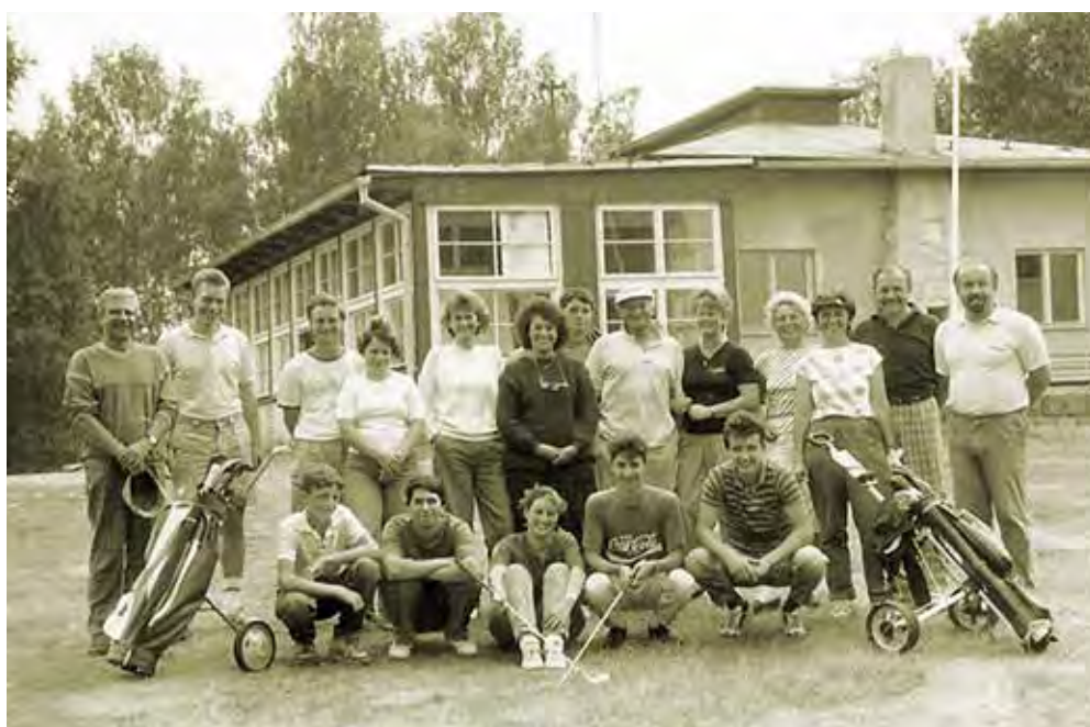
Svratečtí na turnaji družstev v Karlových Varech, 1989

Když se v 80. letech klubu podařilo dostavět chybějící dvě dráhy, byl původní Charvátův plán hřiště v zásadě naplněn. Krátká náročná devítka (2,3 km/par 66) byla rozvržená ve svažitém terénu a cílevědomě komponovaná s využitím velkoryse založených výsadeb a dalších sadařských úprav, jež proměnily původní úhor v lesnatou krajinu. Herní kvalita – golfový koncept – hřiště byla kvintesencí Charvátova mistrovství. Na malé ploše zde realizoval celou škálu triků golfového designu strategického typu, odměňující inteligentní a zejména velmi přesnou