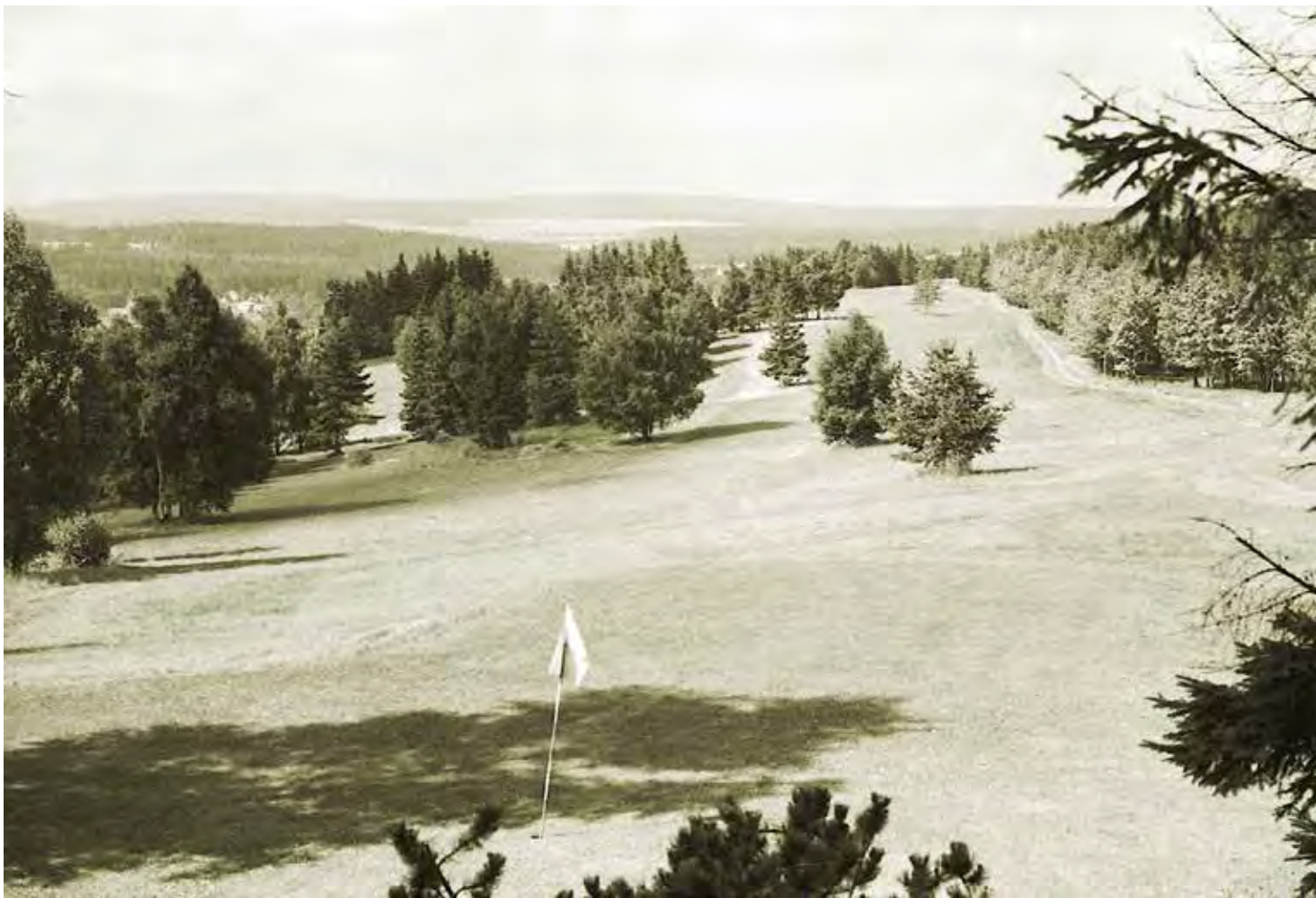
Dnešní jamkoviště č.2 a 4 (foto z r. 1975)

jitele, z něhož se mezitím stala národní výtvarná celebrita, jež svým uměním samostatně překvapila celý svět na bruselském EXPU '58. V tom všem vypomohla mateřská jednota i Český golfový svaz, avšak provozní prostředky na obnovu zarostlého karlístejnského svahu a na činnost klubu samozřejmě nikdo neobstaral, ani práci za jeho členy nevykonával – a že bylo co dělat!