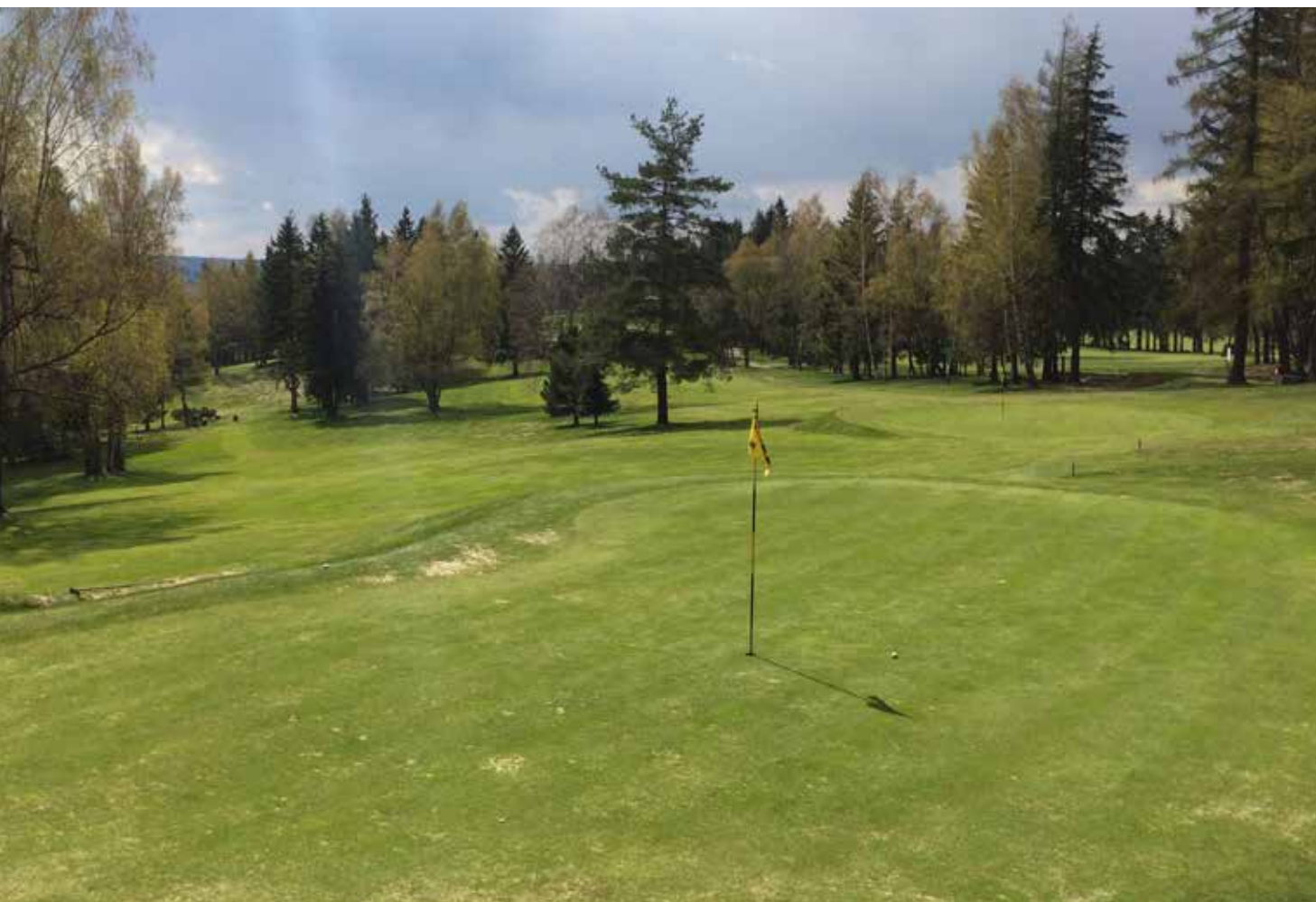
Tentýž záběr o 40 let později (foto z r. 2016)