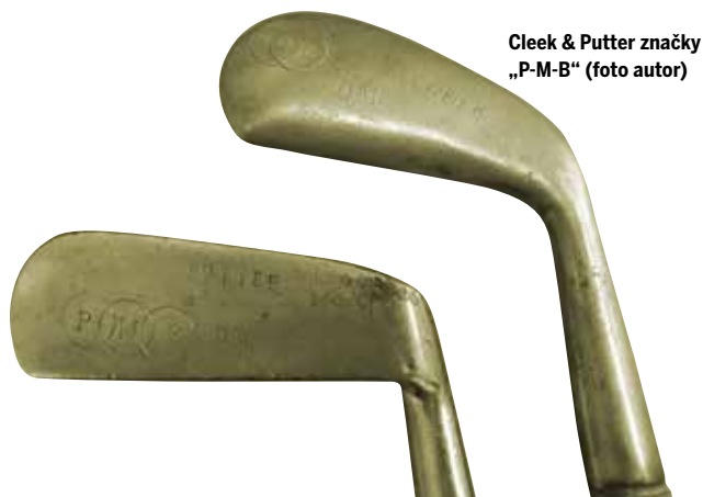
Cleek & Putter značky „P-M-B“