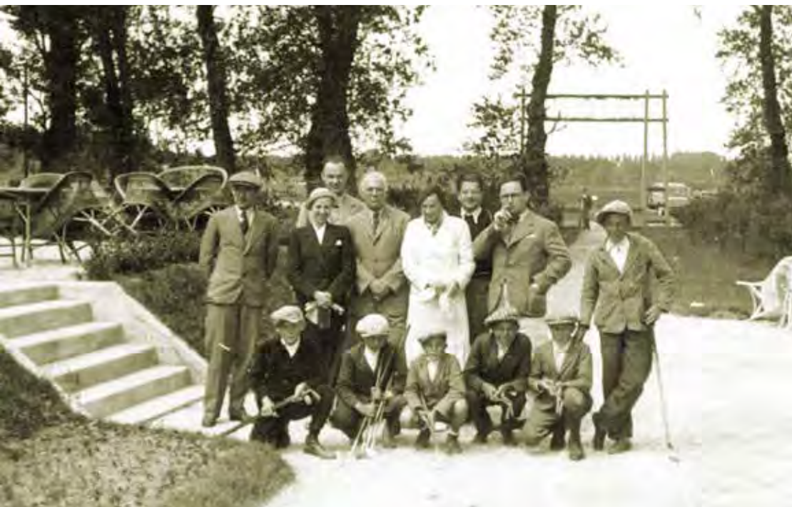
Společnost u vstupu do klubu, 1935

ské Výstaviště a na město v pozadí.“ O sportovně-technických parametrech šesti postupně vybudovaných provizorních jamek, které musely později ustoupit dnešnímu Sídlišti Lesná, nevíme prakticky nic. Přesné umístění „Golf Links“, jak bylo hřiště honosně označeno, známe jen díky dochovanému červenému plánu. Hranice i přístupové cesty jsme se pokusili promítnout do současné mapy.