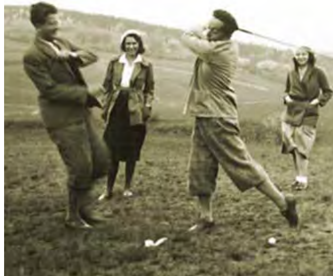
Promo-akce zakladatelů, 1932

architekta Dvořáka, zahrnoval důmyslný systém terčů a sadu pomůcek pro měření délek ran a jejich odchylek od ideálního směru. Iluzi hřiště měly dotvářet překážky (stromy) i promítání fotozáběrů z klánovické jamky č. 6, sloužící coby celuloidový filmový kolorit. Když později za války Golfový kroužek Třemšín opouštěl své leletické působiště, daroval GCB cvičný automat Spotlight Golf.