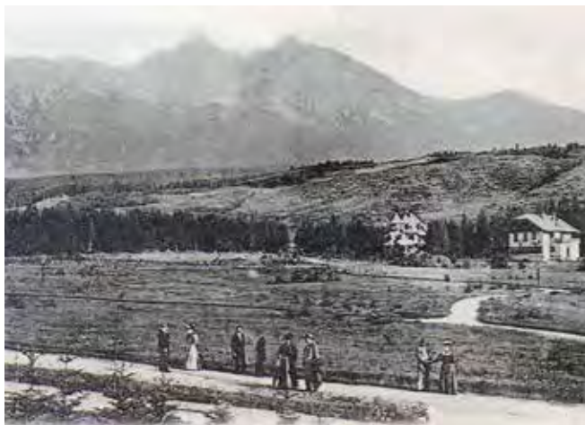
Tatranské panoráma

ce (viz rámeček Od Berzeviců po britské diplomaty).