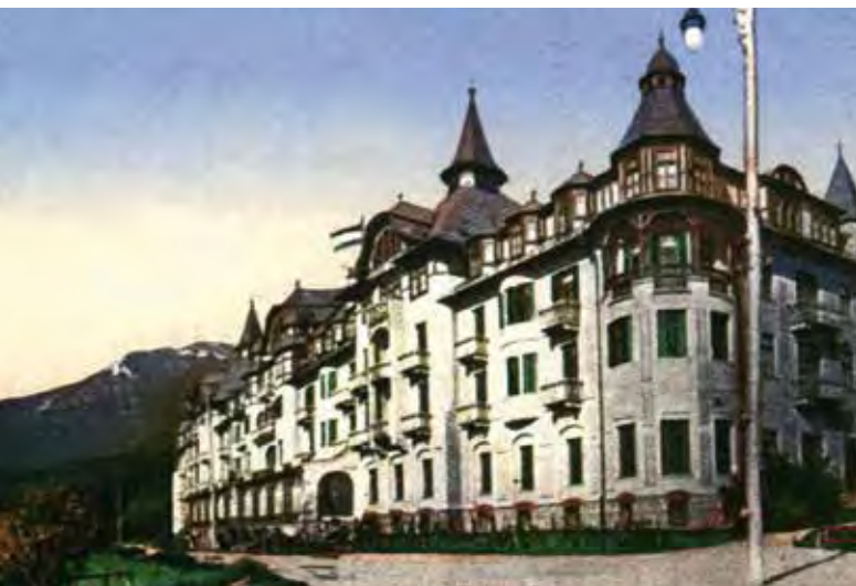
Grandhotel Palác (později Praha) v r.1906... a v současnosti