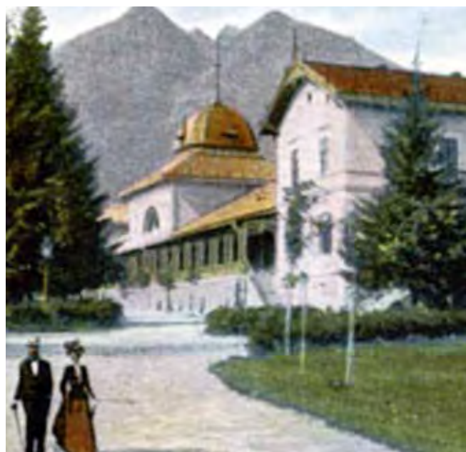
Lázeňský dům v Tatranské Lomnici, 1903

Kořeny golfu na Slovensku lze vystopovat až na práh 20. století a lokalizovat na úpatí Vysokých a Belanských Tater – do krajinného prostoru dnešní Tatranské Lomni-