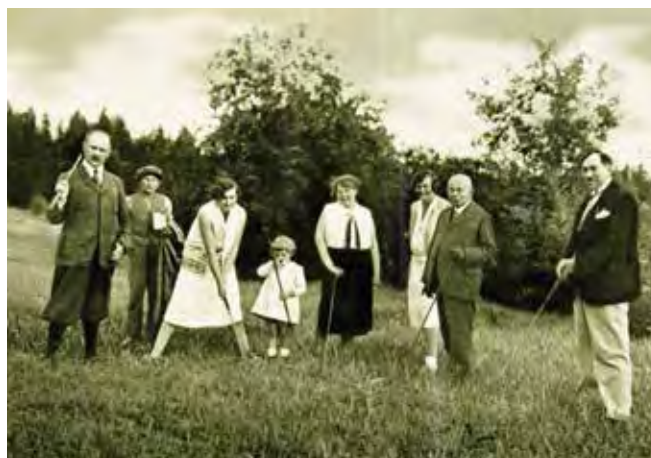
Předseda vlády Dr. Milan Hodža na hřišti v rámci rekonvalescence

Lze se jen domýšlet, že v letech 1936–1937 prošlo hřiště přinej-