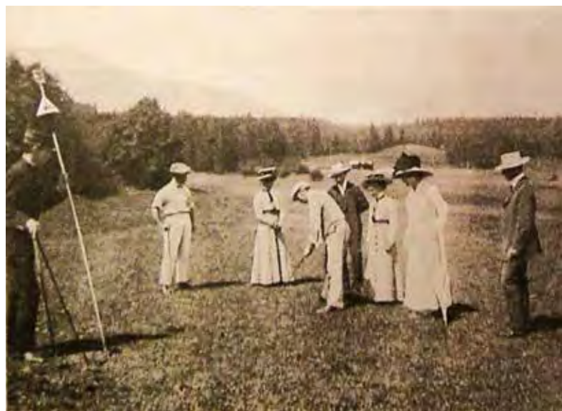
Nejstarší fotodokumentace tatranského golfu