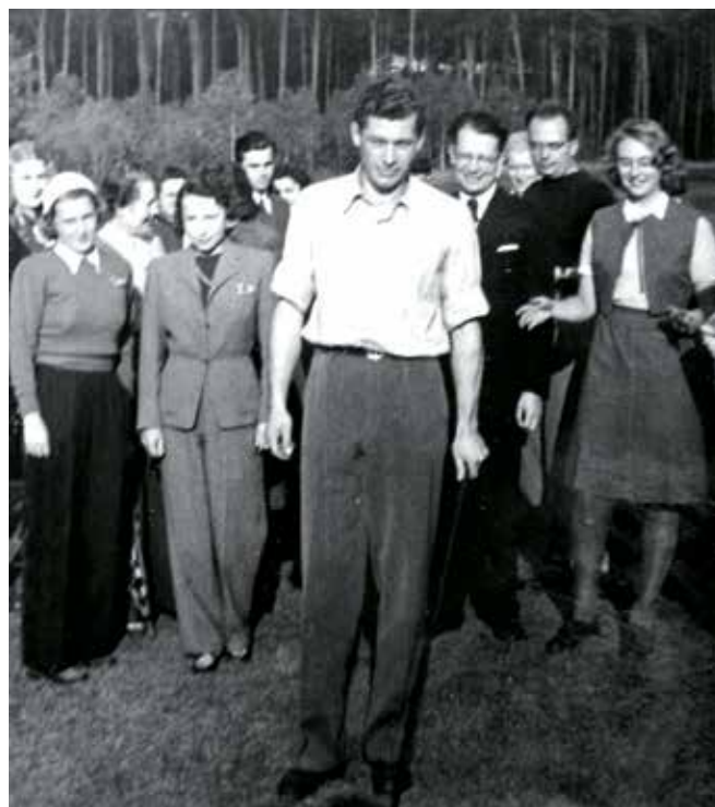
Mistr 1941 (na hřišti v Klánovicích)