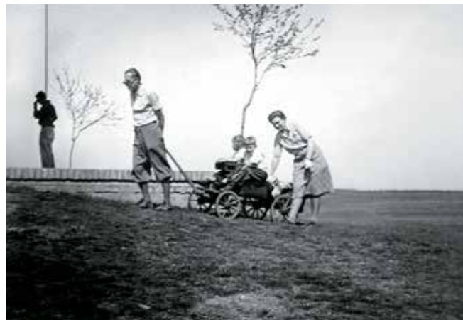
Poválečná doprava na hřiště, 1946