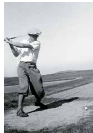
Na odpališti č. 1, 1938