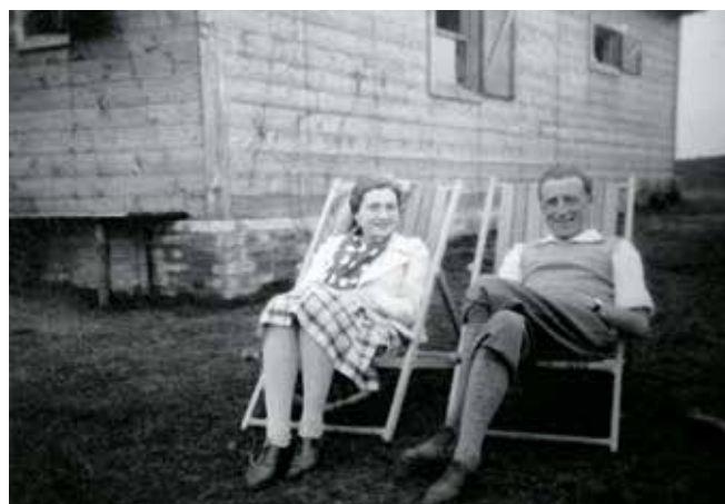
S manželkou před klubovnou, 1934