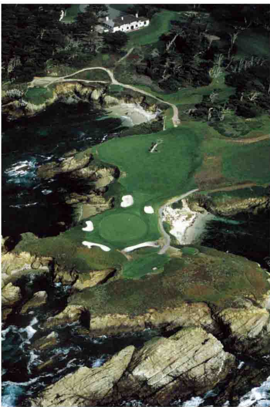
Cypress Point, CA – jamka č. 16 – srdce Holy Trinity