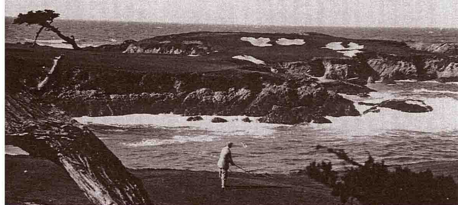
A.M. na odpališti „nejčastěji fotografované jamky všech dob“