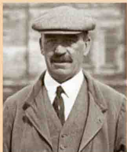
Dr. Alistair Mackenzie (1870–1934)

Po svém návratu z Burské války do Anglie se A.M., přezdívaný „Dobrý doktor“, začal čím dál intenzivněji věnovat navrhování a realizaci greenů a bunkerů, jež svými tvary pobuřovaly dobový britský vkus. Pro tuto zálibu nakonec opustil i svoji lékařskou praxi, aby se mohl na designérskou práci plně soustředit. Vítězství v soutěži o nejlepší tříparovou jamku pro Lido Golf Club (viz perokresba na předchozí straně) mu sice na ceně vyneslo jen 20 liber, ale její mezinárodní publicita mu otevřela dveře do Ameriky. Na pacifických útesech Montereyjského poloostrova (Pebble Beach v Kalifornii) postavil v r. 1928 jedno z nejkrásnějších hřišť Nového světa – Cypress Point . Sekvence jamek č. 15–17, známá jako Holy Trinity , bývá dokonce se zbožnou úctou označována za „Sixtinskou kapli golfu“ (viz dobové foto s A. M. na odpališti a letecký pohled). V Americe strávil Mackenzie zbytek života – hřiště však stavěl i v Austrálii, na Novém Zélandě, v Jižní Africe – a stal se legendou: prvním architektem, který byl v r. 2005 uveden do Světové síně golfové slávy (WGHO). V jejím archivu jsou mj. uloženy originály jeho návrhů k pozdější kalifornské realizaci hřiště Pasatiempo , Santa Cruz (viz skicy 1–6 na protější straně), díky níž byl Bobby Jonesem přizván ke svému životnímu projektu Augusta National .