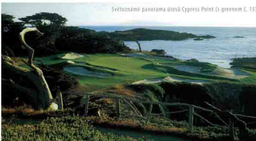
Světznámé panorama útesů Cypress Point (s greenem č. 15)

Po svém návratu z Burské války do Anglie se A.M., přezdívaný „Dobrý doktor“, začal čím dál intenzivněji věnovat navrhování a realizaci greenů a bunkerů, jež svými tvary pobuřovaly dobový britský vkus. Pro tuto zálibu nakonec opustil i svoji lékařskou praxi, aby se mohl na designérskou práci plně soustředit. Vítězství v soutěži o nejlepší tříparovou jamku pro Lido Golf Club (viz perokresba na předchozí straně) mu sice na ceně vyneslo jen 20 liber, ale její mezinárodní publicita mu otevřela dveře do Ameriky. Na pacifických útesech Montereyjského poloostrova (Pebble Beach v Kalifornii) postavil v r. 1928 jedno z nejkrásnějších hřišť Nového světa – Cypress Point . Sekvence jamek č. 15–17, známá jako Holy Trinity , bývá dokonce se zbožnou úctou označována za „Sixtinskou kapli golfu“ (viz dobové foto s A. M. na odpališti a letecký pohled). V Americe strávil Mackenzie zbytek života – hřiště však stavěl i v Austrálii, na Novém Zélandě, v Jižní Africe – a stal se legendou: prvním architektem, který byl v r. 2005 uveden do Světové síně golfové slávy (WGHO). V jejím archivu jsou mj. uloženy originály jeho návrhů k pozdější kalifornské realizaci hřiště Pasatiempo , Santa Cruz (viz skicy 1–6 na protější straně), díky níž byl Bobby Jonesem přizván ke svému životnímu projektu Augusta National .