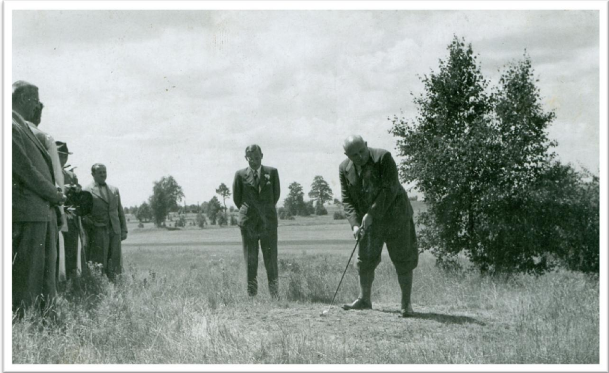
5. Zahájení na hřišti v Olšových Vratech - slavnostní drive starosty města K. Varů