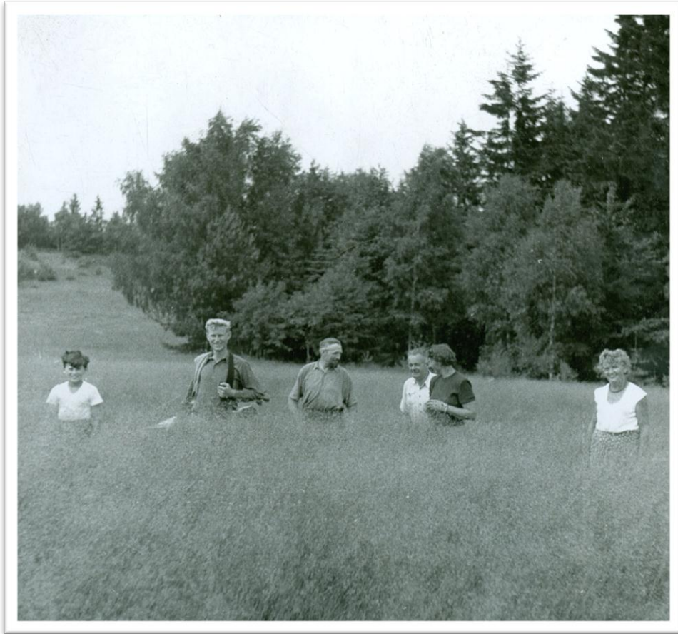
11. Golfisté v Olšových Vratech - na zarostlé jamce č.12 /počátek 50. let/