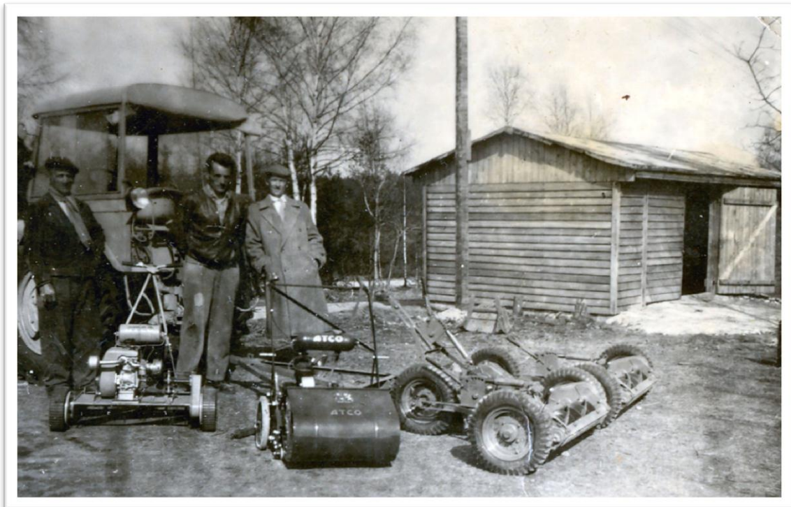
12. Nové sekačky z Anglie na hřišti v Olšových Vratech /leden 1960/