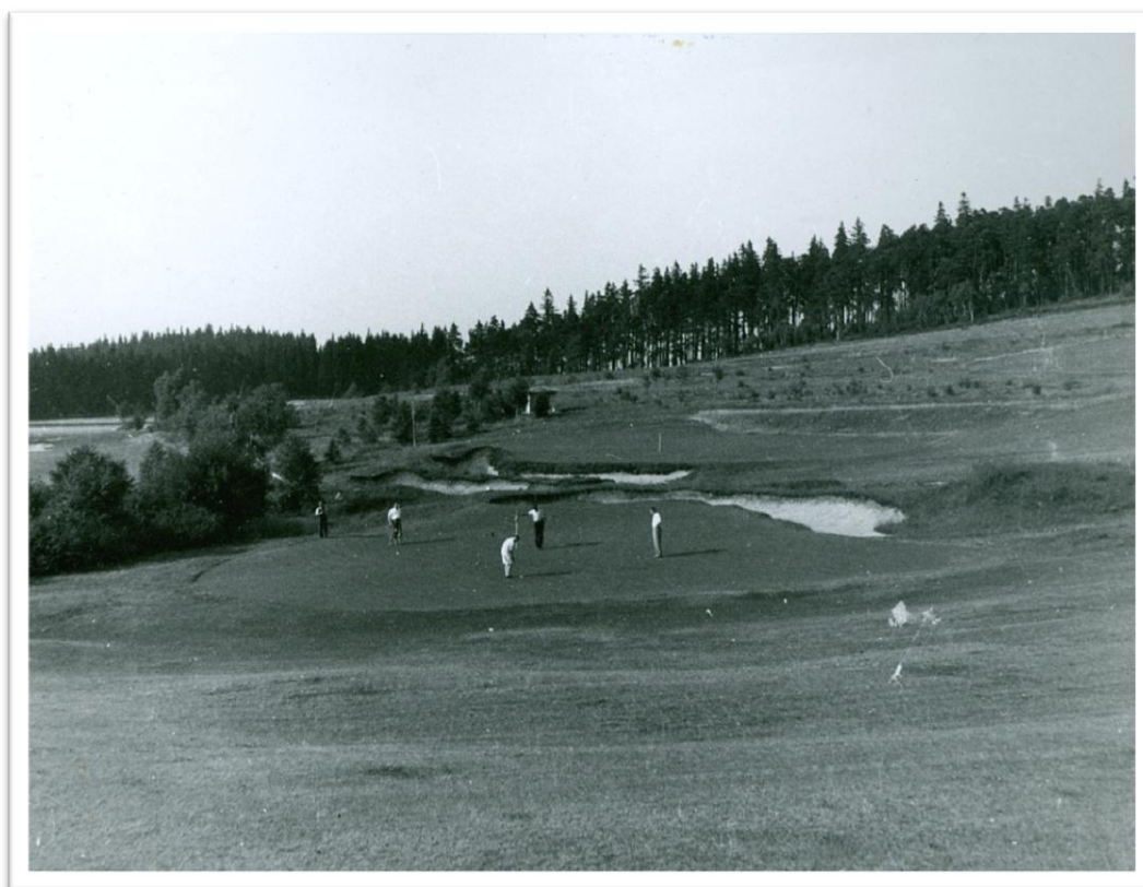
8. V Olšových Vratech - hráči na dnešním greenu č. 4 /v pozadí green č. 1/