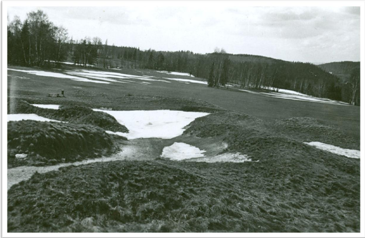
13. Hřiště v Olšových Vratech - jamka č.3, v popředí bunkr mezi jamkami č.2 a č.7 /březen 1968/