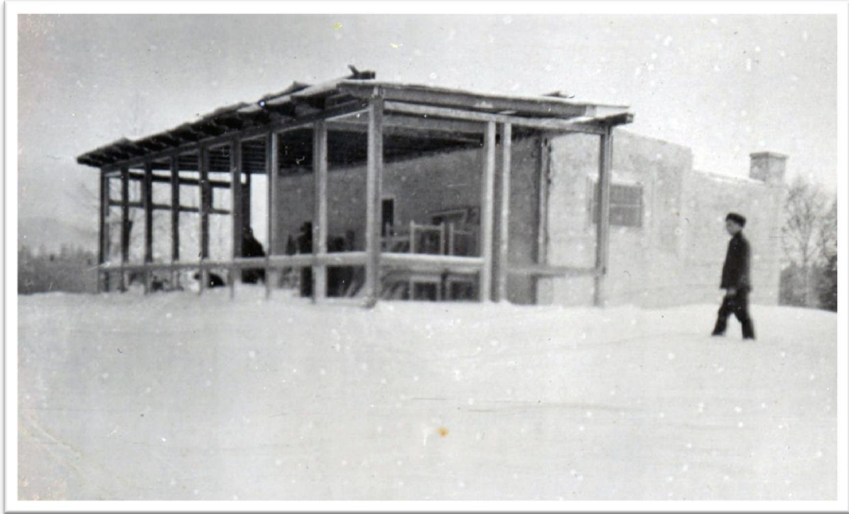
9. Výstavba klubovny na hřišti v Olšových vratech – zimní motiv