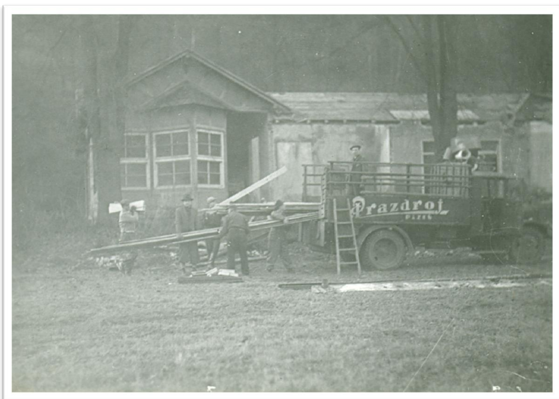
4. Převoz materiálu ze staré klubovny na novou v Olšových Vratech