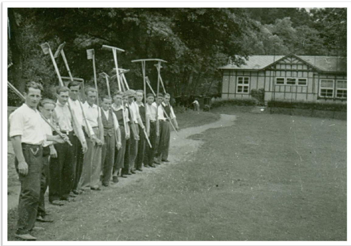
3. Pracovní četa na hřišti v Gejířparku