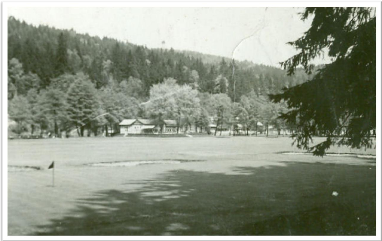
1. Hřiště v Gejzírparku – 30. léta