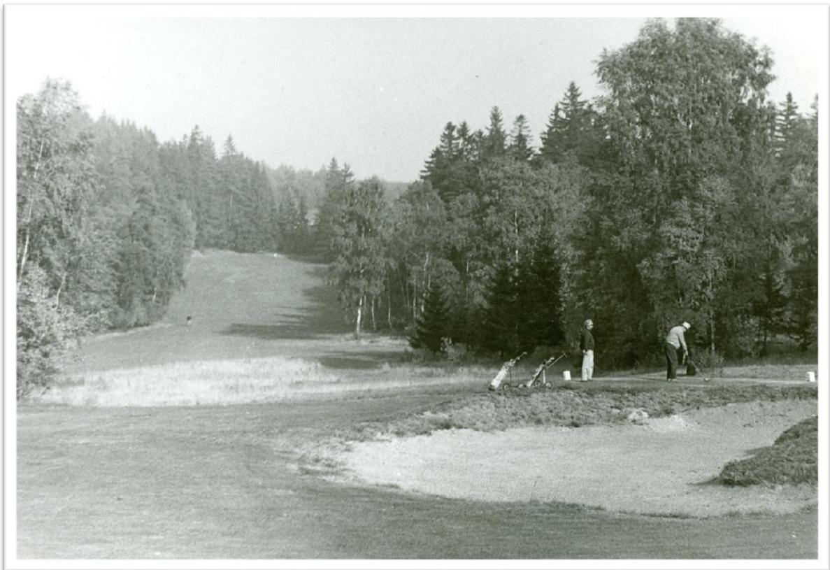
14. V Olšových Vratech - dvojice Müller a Řezáč na jamce č.9 /říjen 1969/