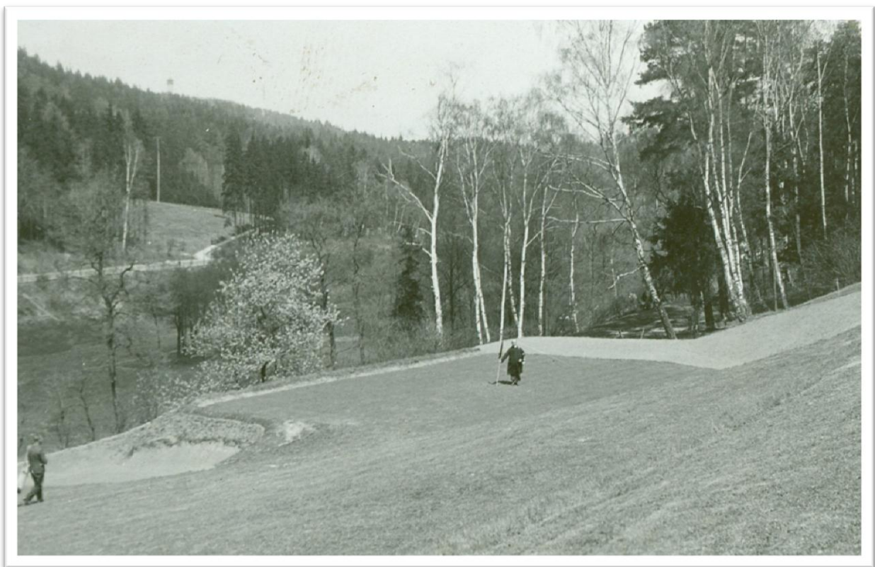
2. Hřiště v Gejzírparku – green č.6