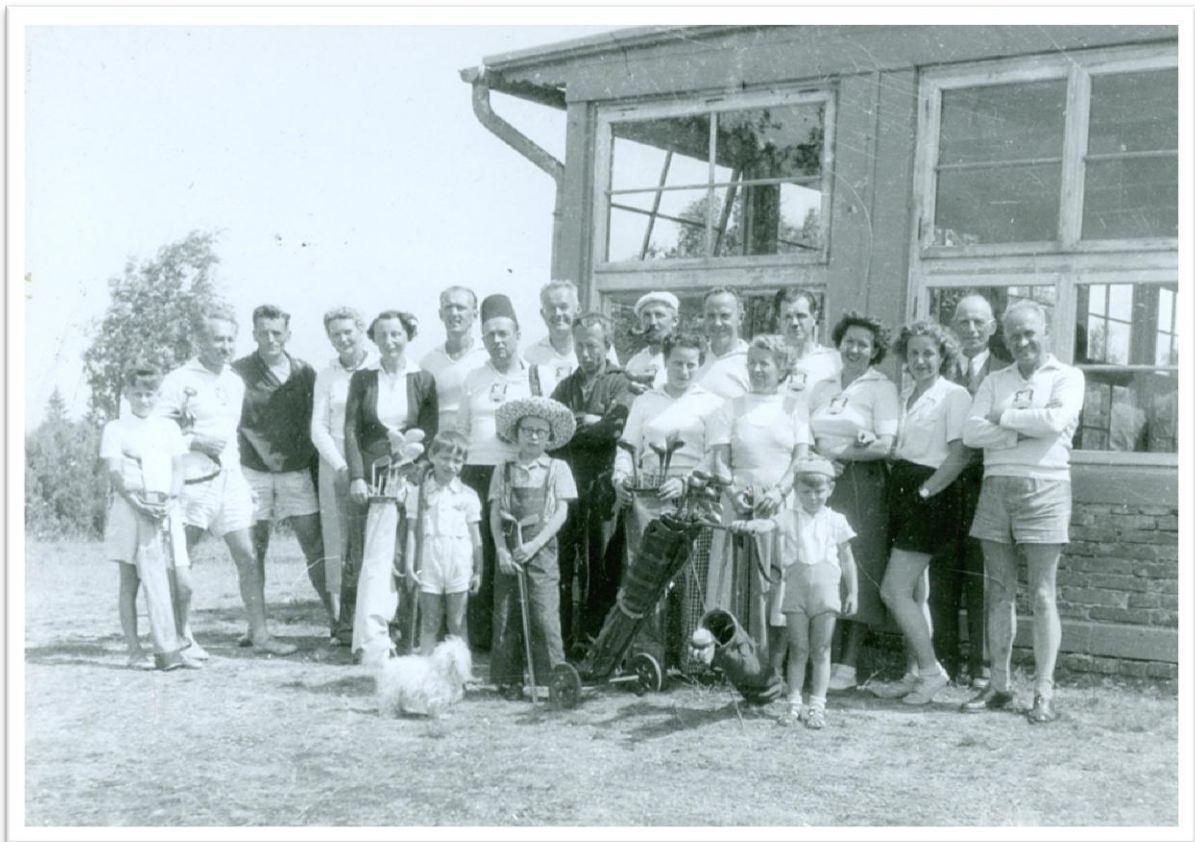
10. Karlovarští golfisté před klubovnou v Olšových Vratech /červenec 1952/